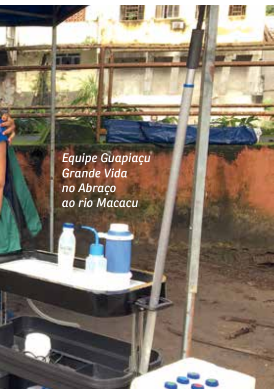
Equipe Guapiaçu Grande Vida no Abraço ao rio Macacu

Acompanhem as atividades do projeto Guapiaçu Grande Vida e aguardem novas surpresas.